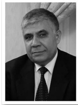
میر عبدالواحد سادات رئیس انجمن حقوقدانان افغان در اروپا